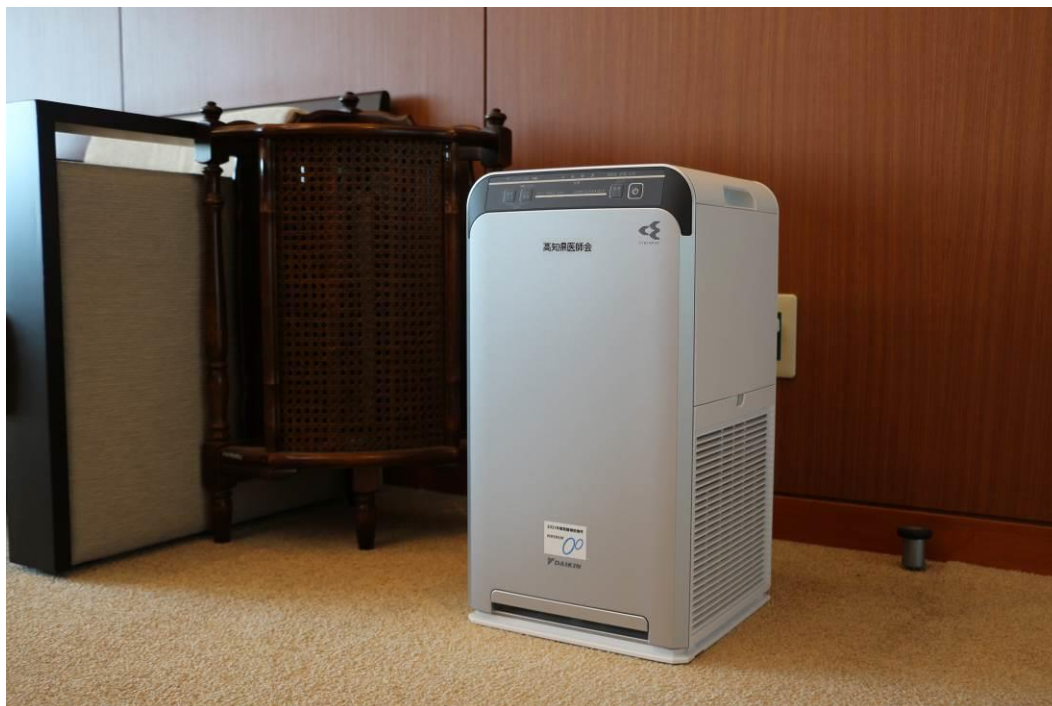
【図3】 ACB50X-S 2/4台