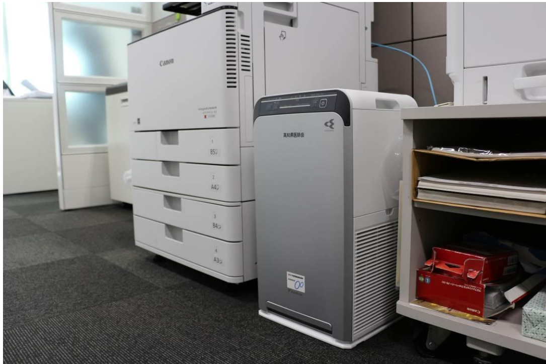
【図5】 ACB50X-S 3/4台